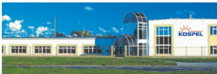
Centrala firmy, ul. Olchowa 1, Koszalin

Obecnie Kospel jest jednym z największych europejskich producentów elektrycznych podgrzewaczy wody, zasobników i wymienników c.w.u., pomp ciepła, kolektorów słonecznych oraz elektrycznych kotłów c.o. Firma posiada 4 nowoczesne zakłady produkcyjne, systematycznie zwiększa sprzedaż, a jej produkty znane są w 57 krajach Świata. Tak imponujący sukces jest możliwy dzięki postawieniu na innowacyjność, rozwój technologii oraz jakość i najwyższy poziom zadowolenia Klientów.