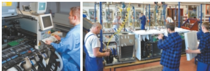
Zakład produkcyjny ul. BoWiD 24, Koszalin

Działy sprzedaży krajowej i handlu zagranicznego, doradztwo techniczne, dział graficzny, centrum serwisowe.