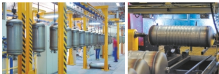
Zakład produkcyjny Damnica

Hale o powierzchni 8.700m 2 - produkcja podgrzewaczy, kotłów i pomp ciepła, dział konstrukcyjny, zaopatrzenie, księgowość, kadry.